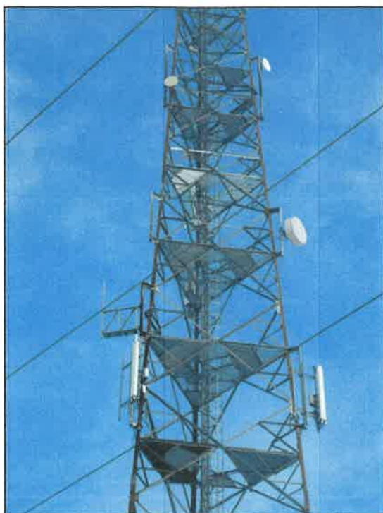
Rys. 4 Widok badanego obiektu