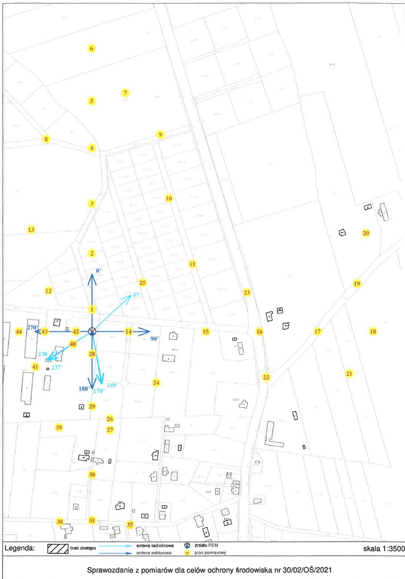
Rys. 2 Lokalizacja pionów pomiarowych